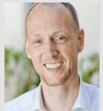
Christian Riethmüller Osiandersche Buchhandlung