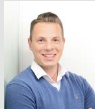
Philipp Kreuzer Sportbuzzer (MADSACK Mediengruppe)